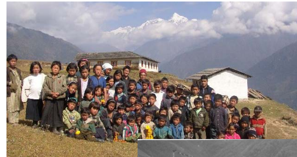
Une école sur le Toit du Monde à Techlim Gumdel