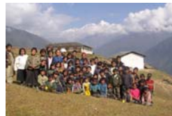
Portraits de Techlim Gumdel Ecole Mount Holy Numbur Vision Primary School